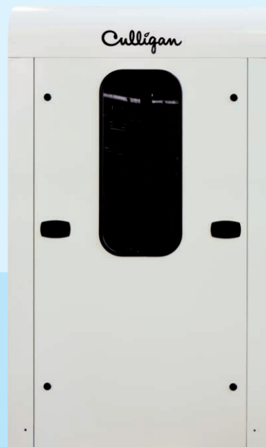
BIOSMOSI Medical Device