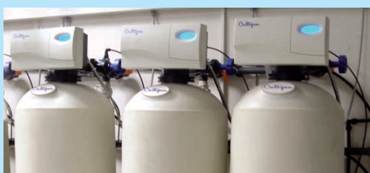
Particolare del pre- trattamento